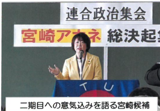
二期目への意気込みを語る宮崎候補