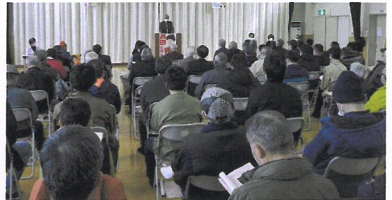
(多くの皆さんが集まった会場風景)