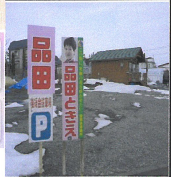
風花さん隣の交差点側